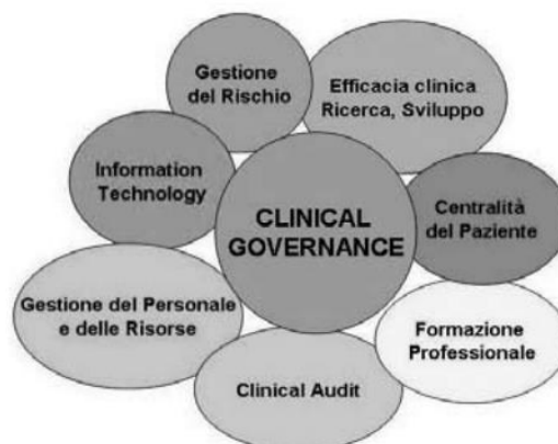
Componenti della CLINICAL GOVERNANCE